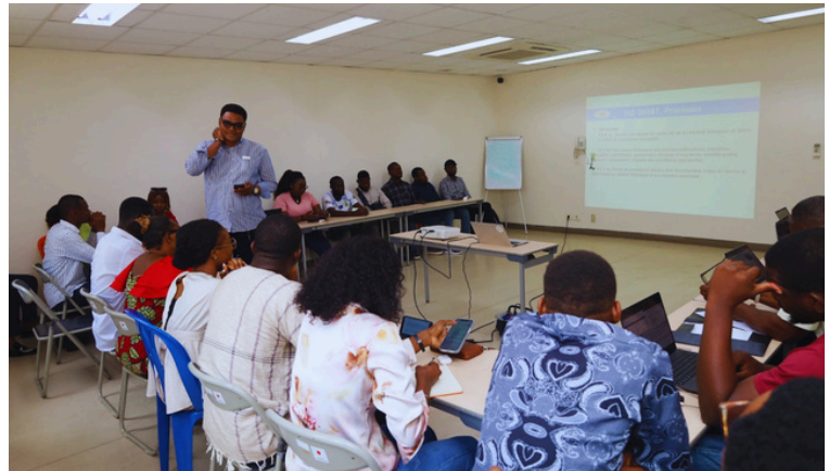
Renforcement des capacités en biobanking : formation à la norme ISO 20387 à l'Institut National de Recherche Biomédicale