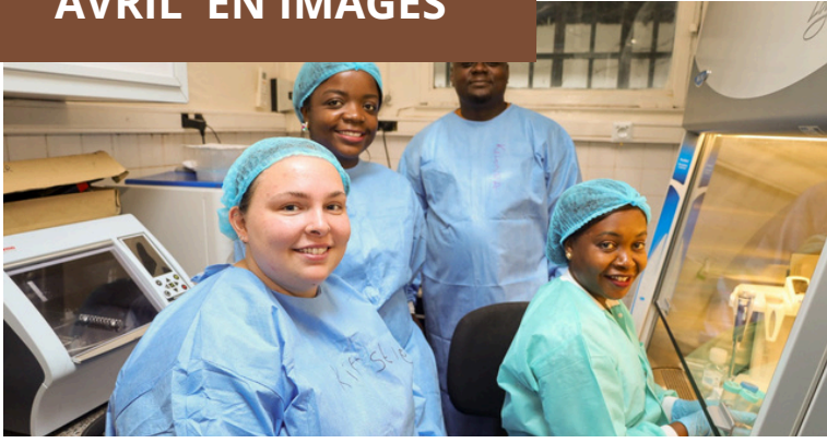
Formation sur la validation des méthodes de concentration ENF et Ceres au Laboratoire de Génomique des Pathogènes.