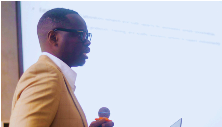
Intervention du membre du LGP sur l'accélération de la réponse aux épidémies: la génomique des eaux usées et la voie vers 7-1-7, au workshop ComPHA 2026 à Nairobi.