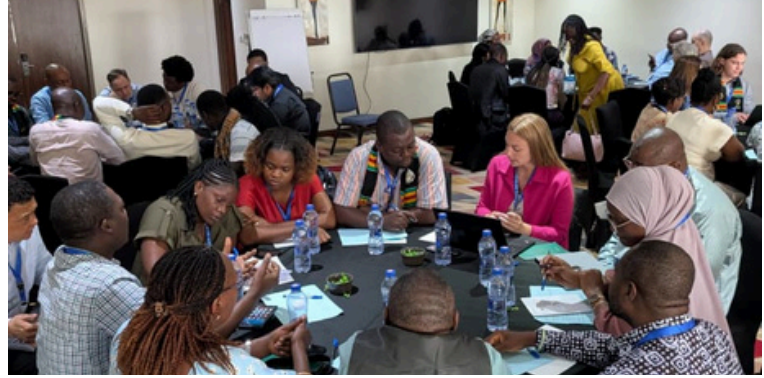
Séance de travail lors la conférence WES 2026 (Wastewater & Environmental Surveillance Meeting) à Accra.