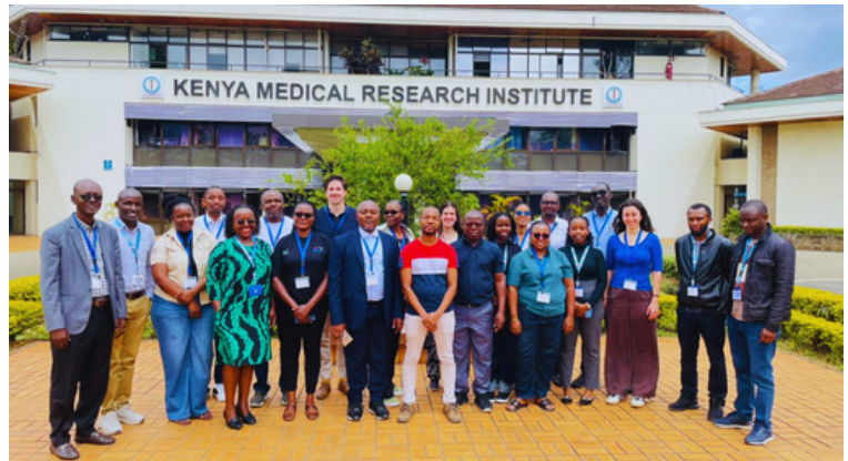
Photo de famille entre les participants et les formateurs, lors de l'atelier CholGEN et la génomique avancée, tenu à Nairobi.