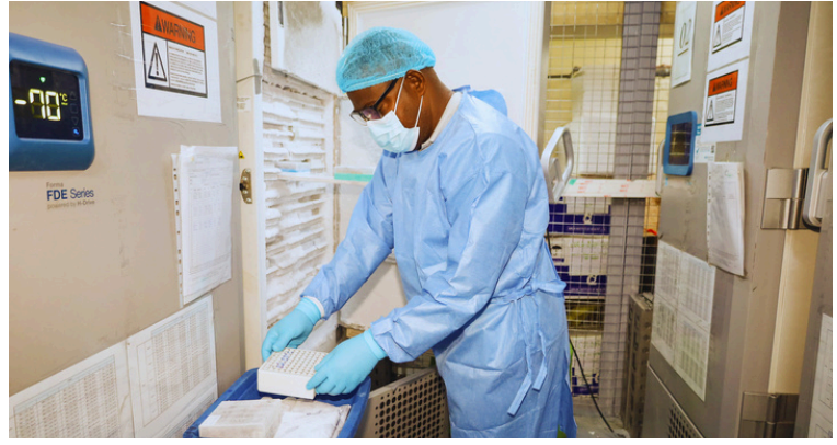
Retrait des boîtes des unités cryogéniques en vue de leur tri sur la paillasse, au sein de la zone de travail.