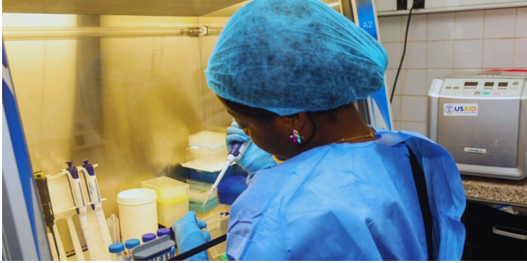
Préparation du master mix avec le kit Radi Fast pour la PCR des échantillons de Mpxv.